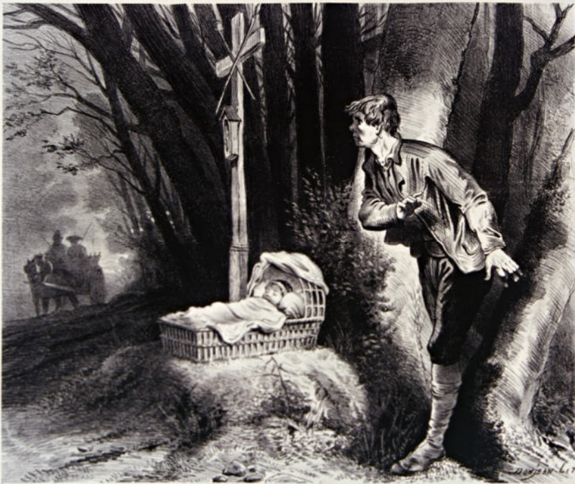
Fig. 3 - 'L'enfant trouvé' (1876), door Etienne Enault, verschenen in 'Le Journal du Dimanche' (Parijs)