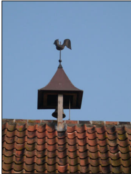
Fig. 2 - Dakruiter met klokje en windhaan op de nok van het Klokhof

De Duitsers moesten de weg afleggen rond de hofstede naar de grote ingang. De kleine ingang rechtstreeks naar de straat bestond toen nog niet, die is pas in 1950 door ons aangelegd om niet altijd de weg te moeten gaan waar ook de koeien en de karren kwamen. Het kostte de Duitsers dus enige tijd voor zij de voordeur bereikten. Inmiddels was de schuilplaats afgedekt en was vader weer aan de voordeur.