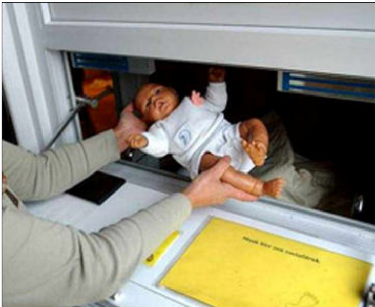
Fig. 4 - Vondelingenluik in Borgerhout (Antwerpen)