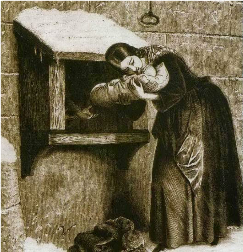
Fig. 1 - Een moeder laat haar kindje achter in een vondelingenschuif

ding. De C.B.G. was verplicht haar rekeningen door te sturen naar het gemeentebestuur, dat ze op zijn beurt ter goedkeuring overmaakte aan de departementale overheid. De gemeentebesturen dienden de budgettaire tekorten van de C.B.G. aan te vullen. De C.B.G. stond in voor de gehospitaliseerde behoeftige medemens. De weeshuizen stonden onder de bevoegdheid van de C.B.G.