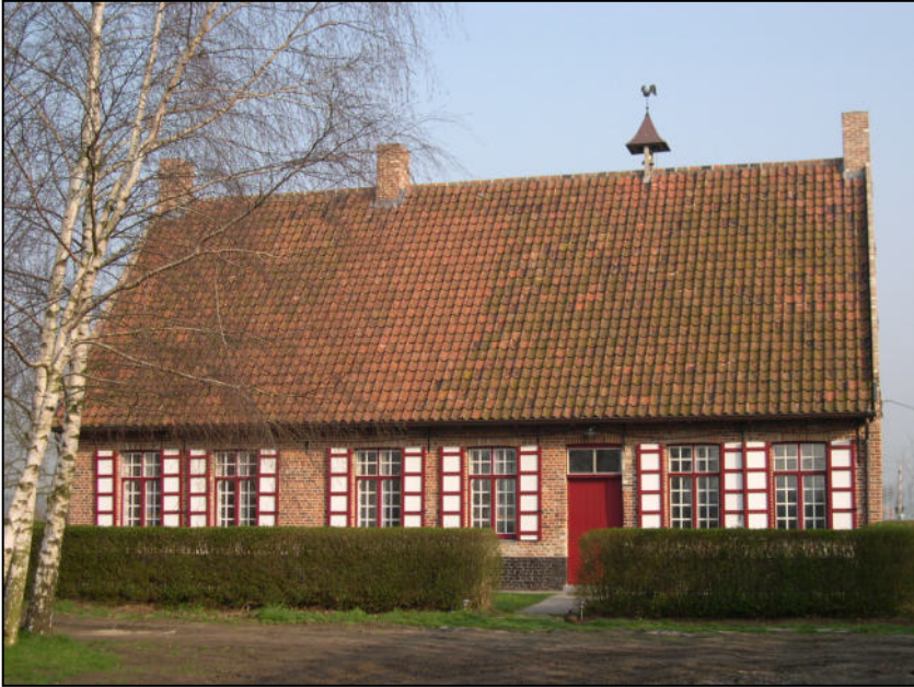
Fig. 3 - Het Klokhof na de restauratie van 2003

... de plantaardappelen in het voorjaar ... De zolder verloor aan belang. Vermits voortaan niemand nog in de bovenkamers sliep, werden nu ook de houten wanden weggenomen.