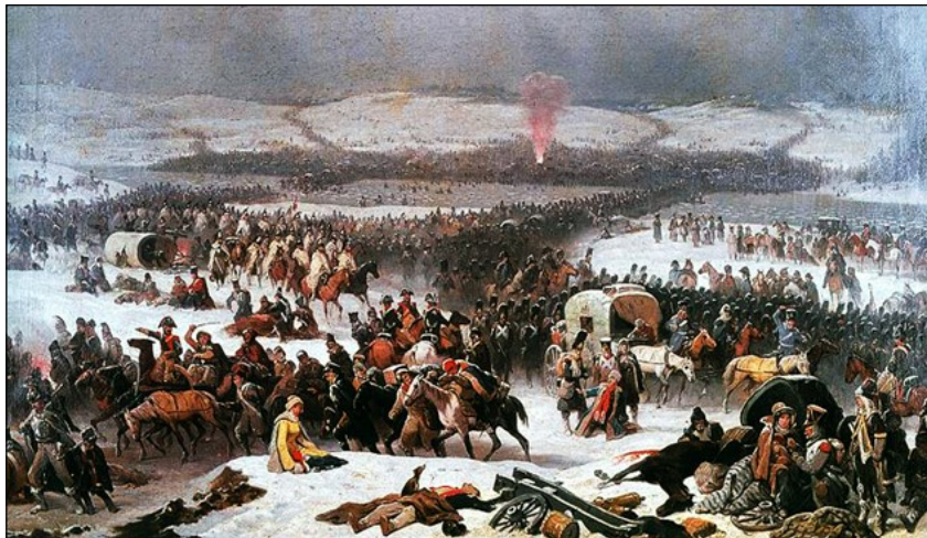
Fig. 4 - Berezyna - January Suchodolski 132 - National Museum, Poznan (Polen)