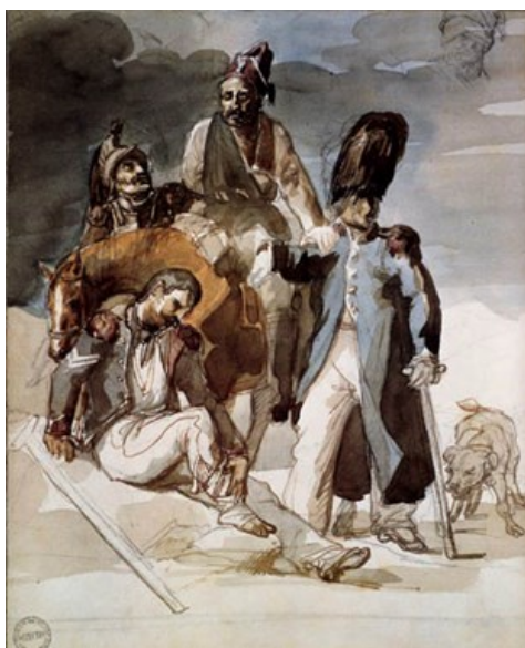
Fig.7 - Théodore Géricault (1791-1824) La retraite de Russie (aquarel)