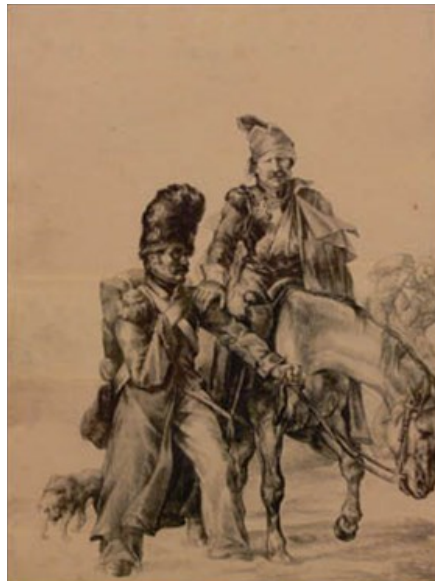
Fig. 8 - Théodore Géricault (1791-1824) Retour de Russie (lithografie, 1818) Musée des Beaux-Arts, Rouen