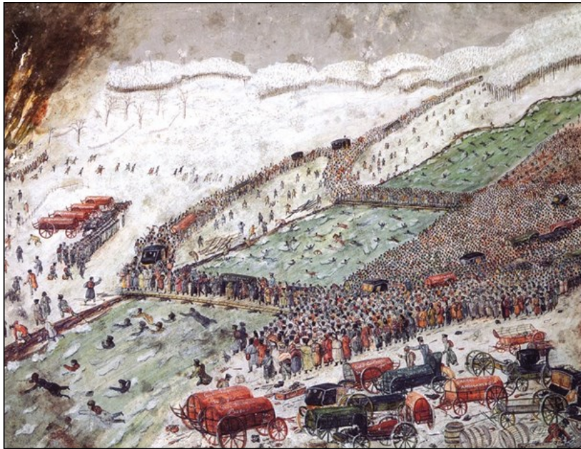
Fig. 3 - Passage de Berezina - Fournier 131 , 1812 - Musée de l'Armée, Paris