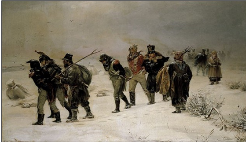
Fig. 2 - En 1812 - Illarion Pryanishnikov 129 , 1874

voor het licht, maar overdag was het nog +6 à 10 °C.