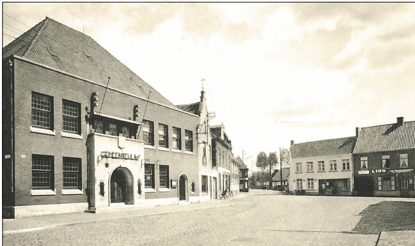
Fig. 6 - Zicht op het Loppemse gemeentehuis van 1939 met aanpalende huizen. Opname uit de vijftiger jaren.