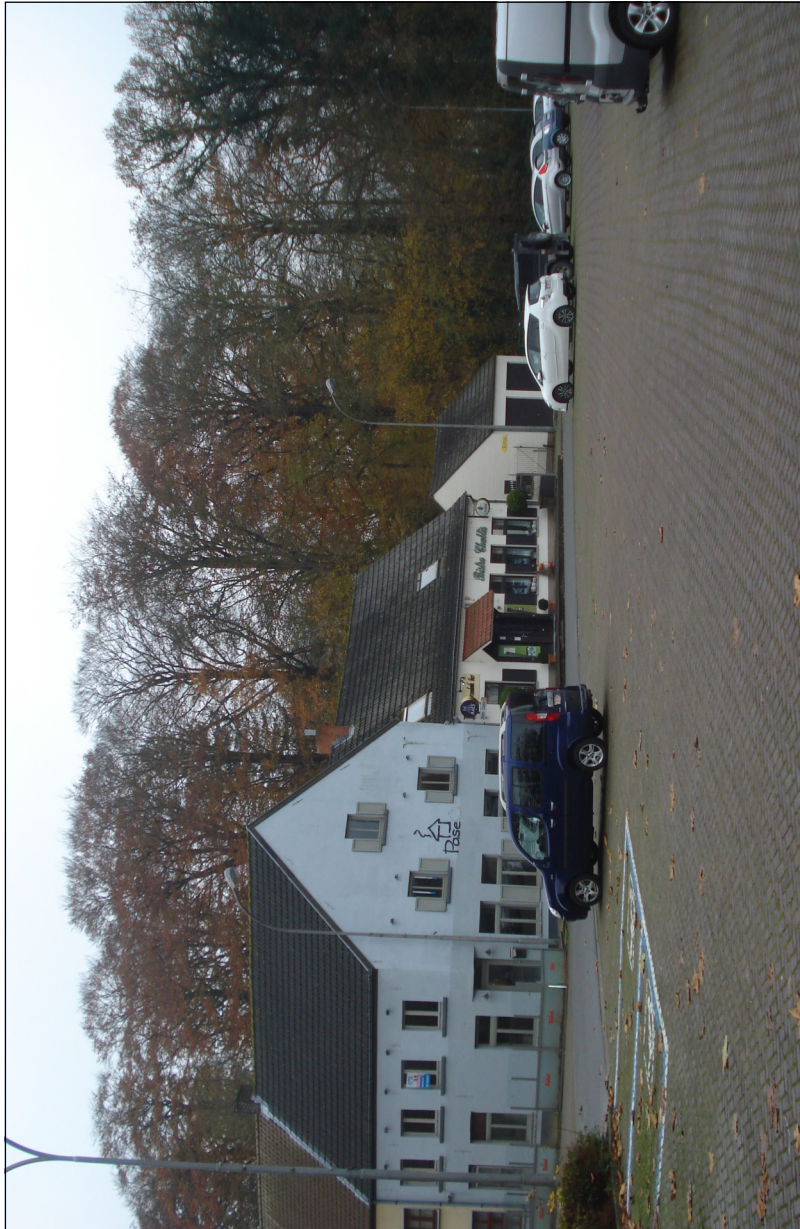
Fig. 5 - De buurt van kerk en markt, anno 2014.