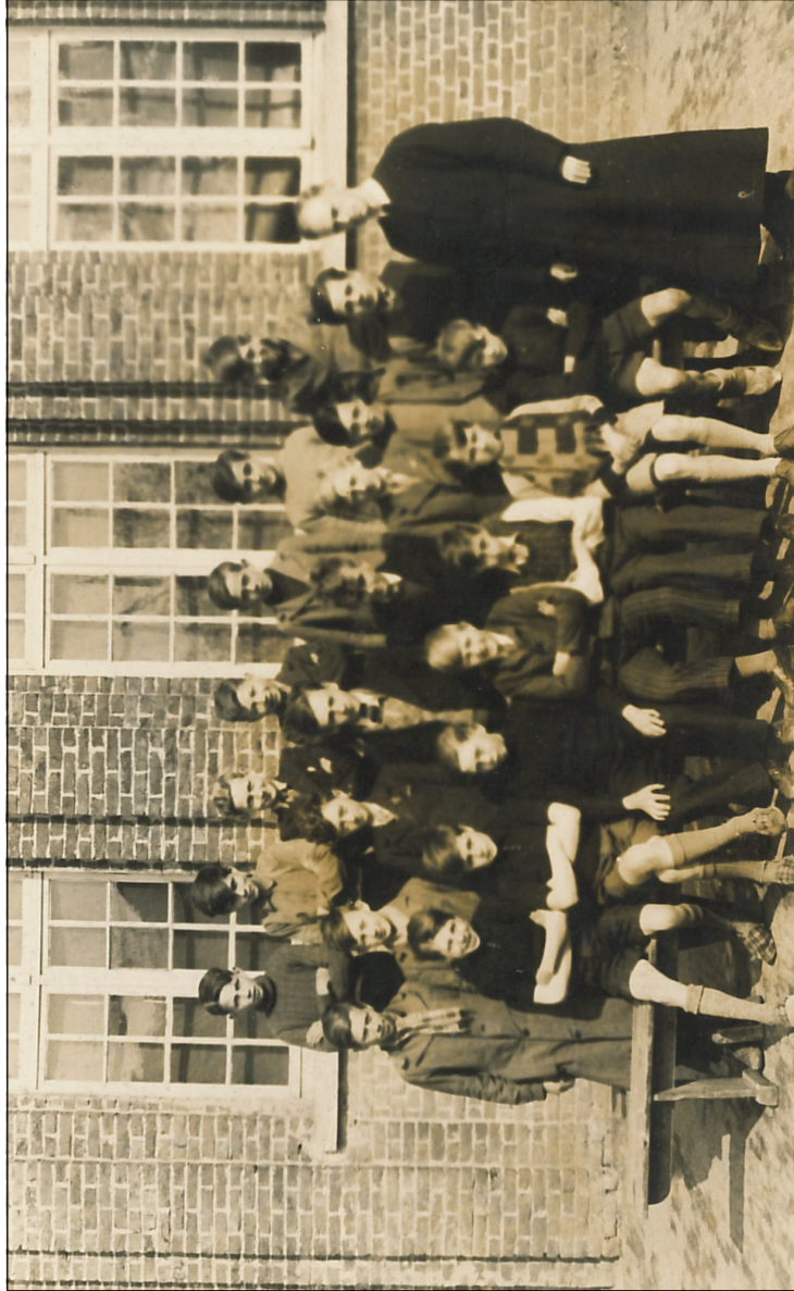
Fig. 1. Het 7e leerjaar van de Zedelgense Sint-Leoschool (Groenestraat) tijdens het schooljaar 1941-1942