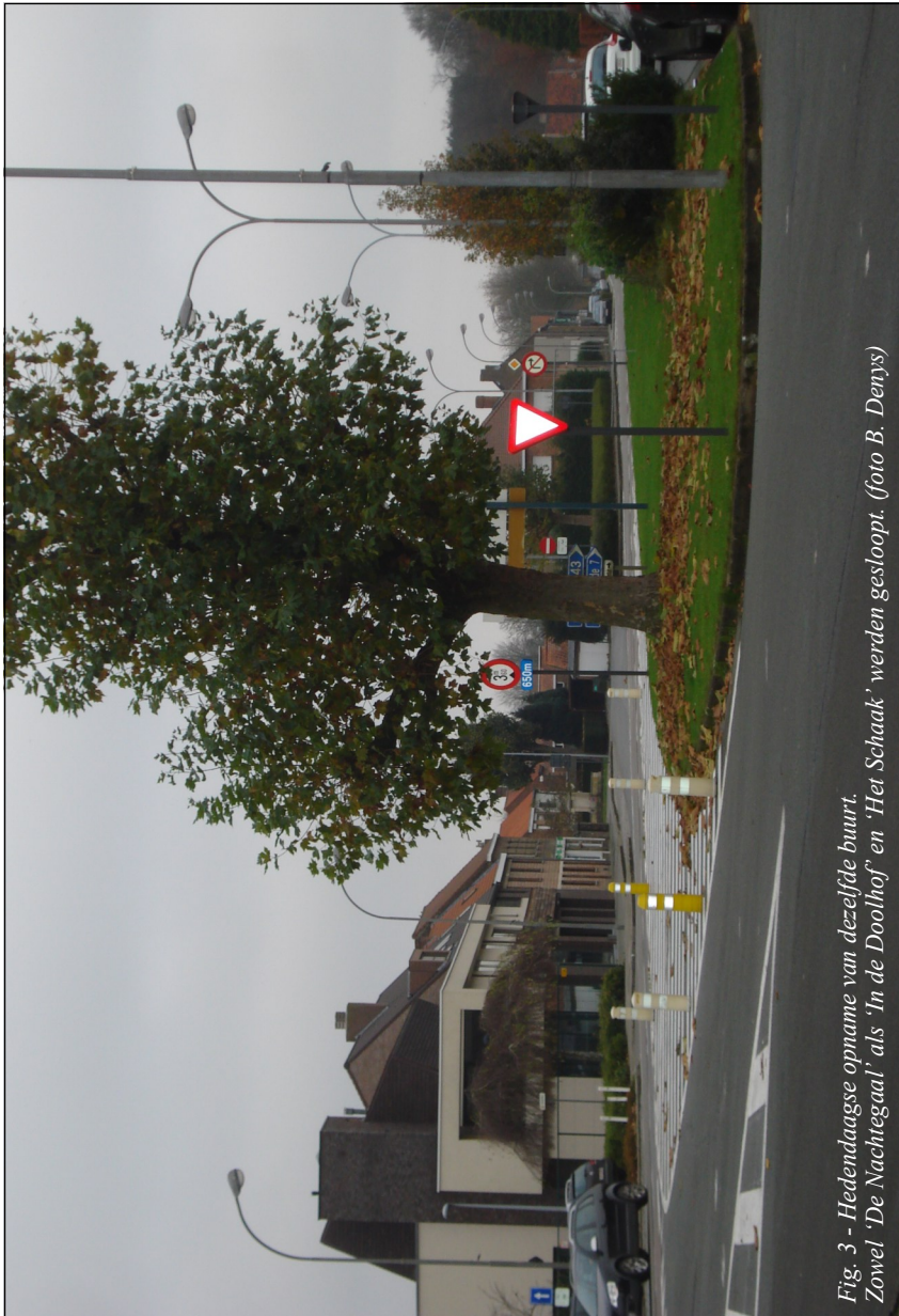
Fig. 3 - Hedendaagse opname van dezelfde buurt. Zowel 'De Nachtegaal' als 'In de Doolhof' en 'Het Schaak' werden gesloopt.