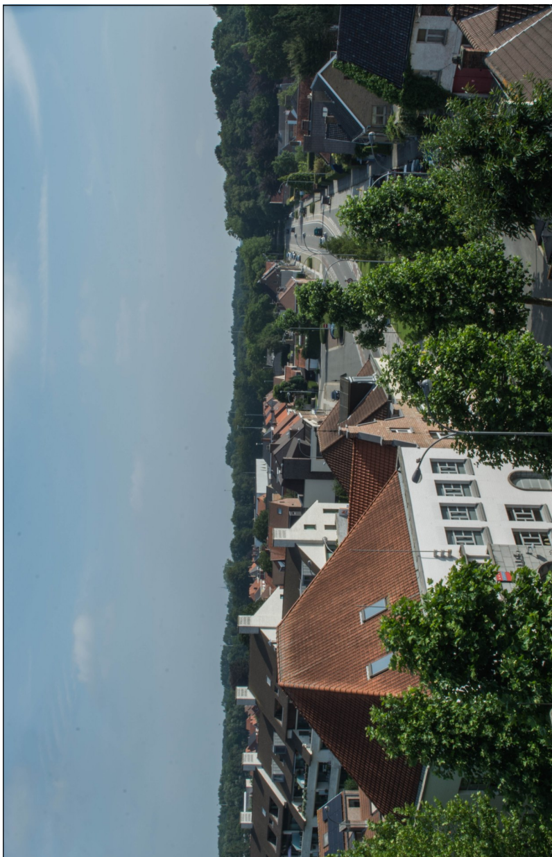
Fig. 8 - Hedendaagse opname van op de kerktoren van de Loppense dorpskom en de Steenbrigsestraat.