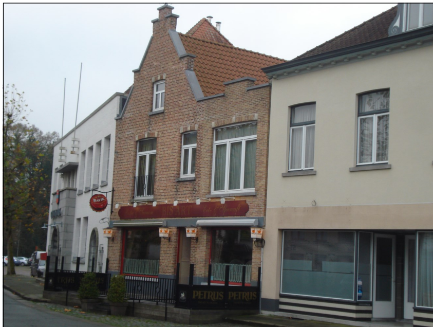
Fig. 7 - Hetzelfde gemeentehuis en de aanpalende panden.