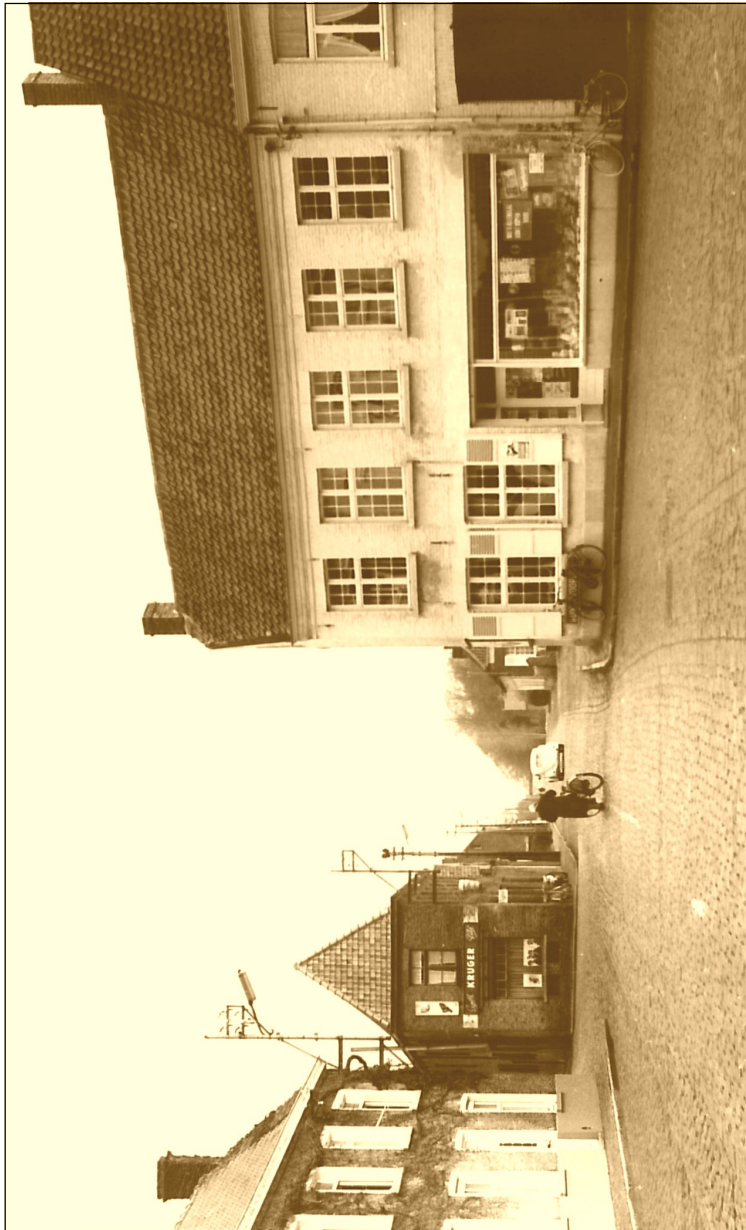
Fig. 2 - De Steenbrugsestraat richting St.-Michiels, einde jaren 1950 of begin jaren '60. Vooraan links 'Het Schaak', achteraan links, tussen Kapellestraat en Steenbrugsestraat café 'In de doolhof', rechts op de voorgrond de oude afspanning 'De Nachtegaal'.