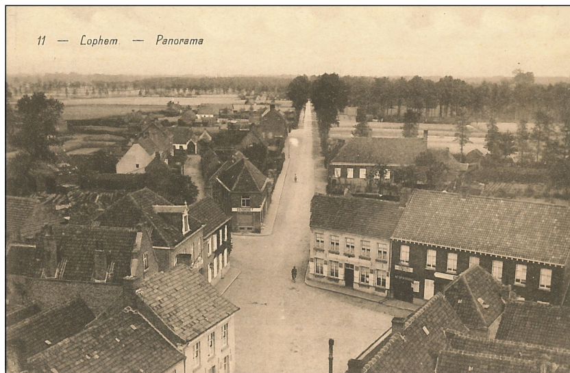
Fig. 1 - Panorama van de Loppemse dorpskom en de Steenbrugsestraat, anno 1913. Links vooraan twee woningen, gesloopt voor het gemeentehuis in 1939, daarachter bakkerij en herberg 'De Zwaan' van Richard De Knock (nog bestaande), herberg 'Het Schaak' (gesloopt in 1974) en café 'In de Doolhof' (gesloopt in de zeventiger jaren). Rechts 'De Nachtegaal' (gesloopt in de zestiger jaren) en het nog bestaande 'Gemeentehuis'.