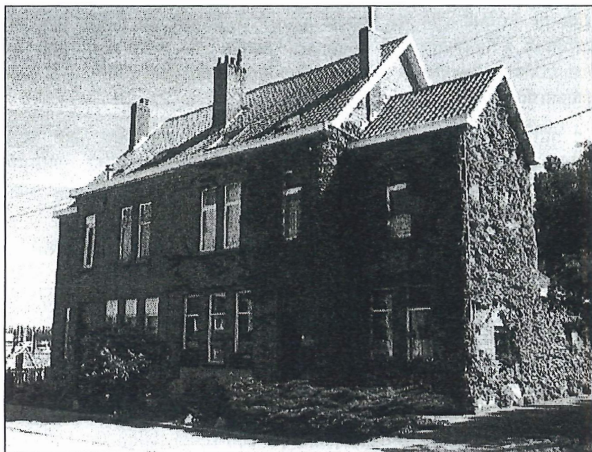
De officierswoningen in de Kronestraat.

is te merken aan het gebruik van een andere gevelsteen die veel gelijkenis vertoont met die van het blok M.