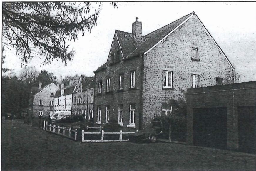
De 10 "arbeiderswoningen" in de Vloethemveldstraat.

Een nadeel voor de witte lintjes was dat de officiers- en onderofficierswoningen gelegen waren langs hun weg naar en van het dorp. In de tijd dat er nog veel gestapt werd, was het heengaan geen probleem, maar terugkeren hield een zeker risico in.