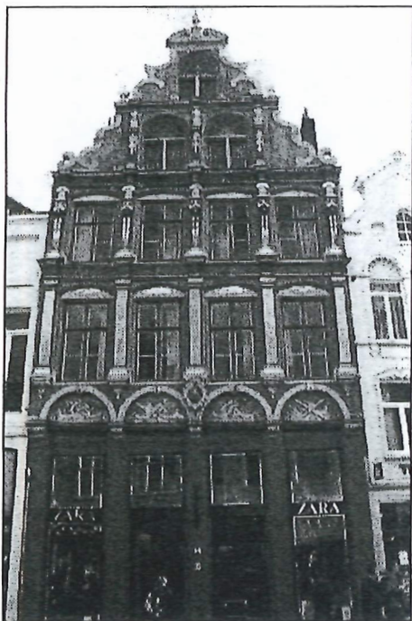
“De Slotele”, Steenstraat, 25 te Brugge, zoals die er nu uitziet.