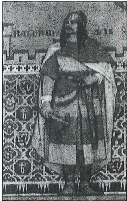
Boudewijn Hapken, zoals hij afgebeeld staat in de gotische zaal van het Brugse stadhuis.

“...ende ten dien fine, zo reedt hy (= Graaf Boudewijn) meest altijts omtrent zijn casteel te Wijnendale (daer hy hem hielt), met een hapkin in dhandt (daer hy noch ten daghe van hedent die toename ofte bijname af behouden heeft), teekende daer mede, waer hier waer daer, alle die boomen die bequaemst waren omme die voornoemde roovers, vertasseerders 6 ende andere quaetdoeners an te hangene ofte om galghen of te makene”.