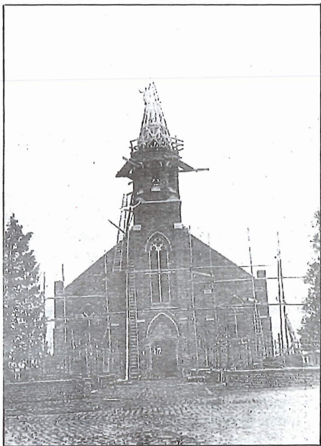
Herstel van de kerk van Veldegem na de beschieting van 1918.