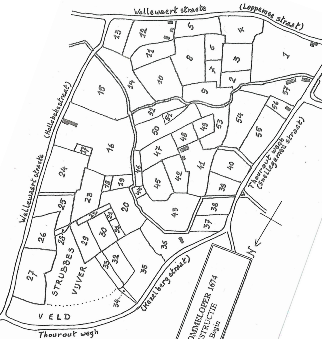
KAART BIJ OMMELOPER 1674 RECONSTRUCTIE 1ste Begin