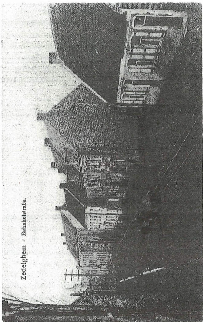
Zedelghem - Bahnhofstraße.