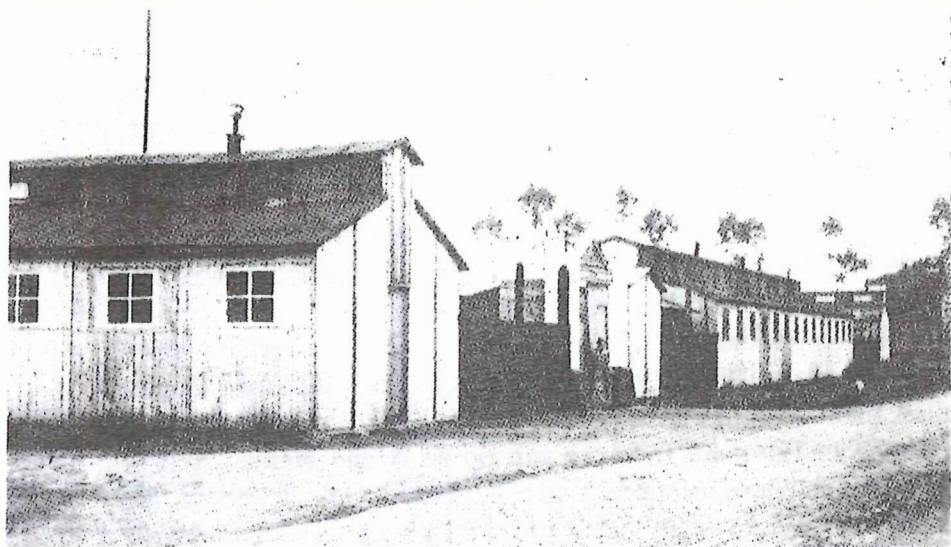
Duitse barakken langs de Ruddervoordsestraat. (Uit: BONDUEL L., Het Zedelgem, Veldegem, Loppem en Aatrijke van toen", Brugge, 1983, p. 32)