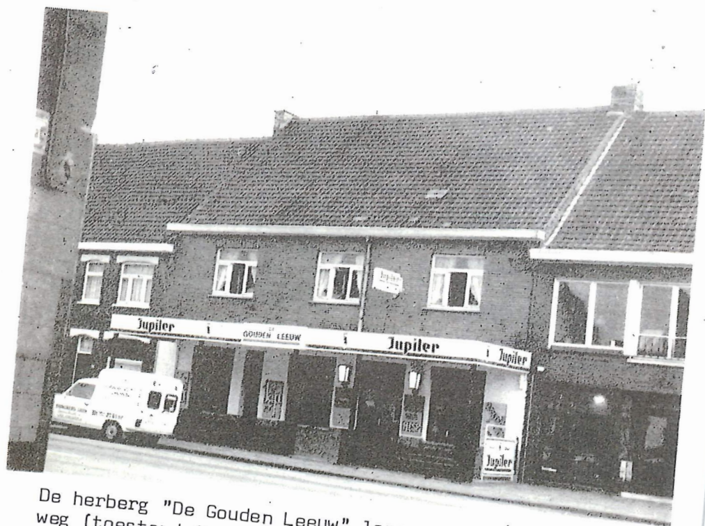
De herberg "De Gouden Leeuw" langs de Torhoutsesteenweg (toestand 1981).